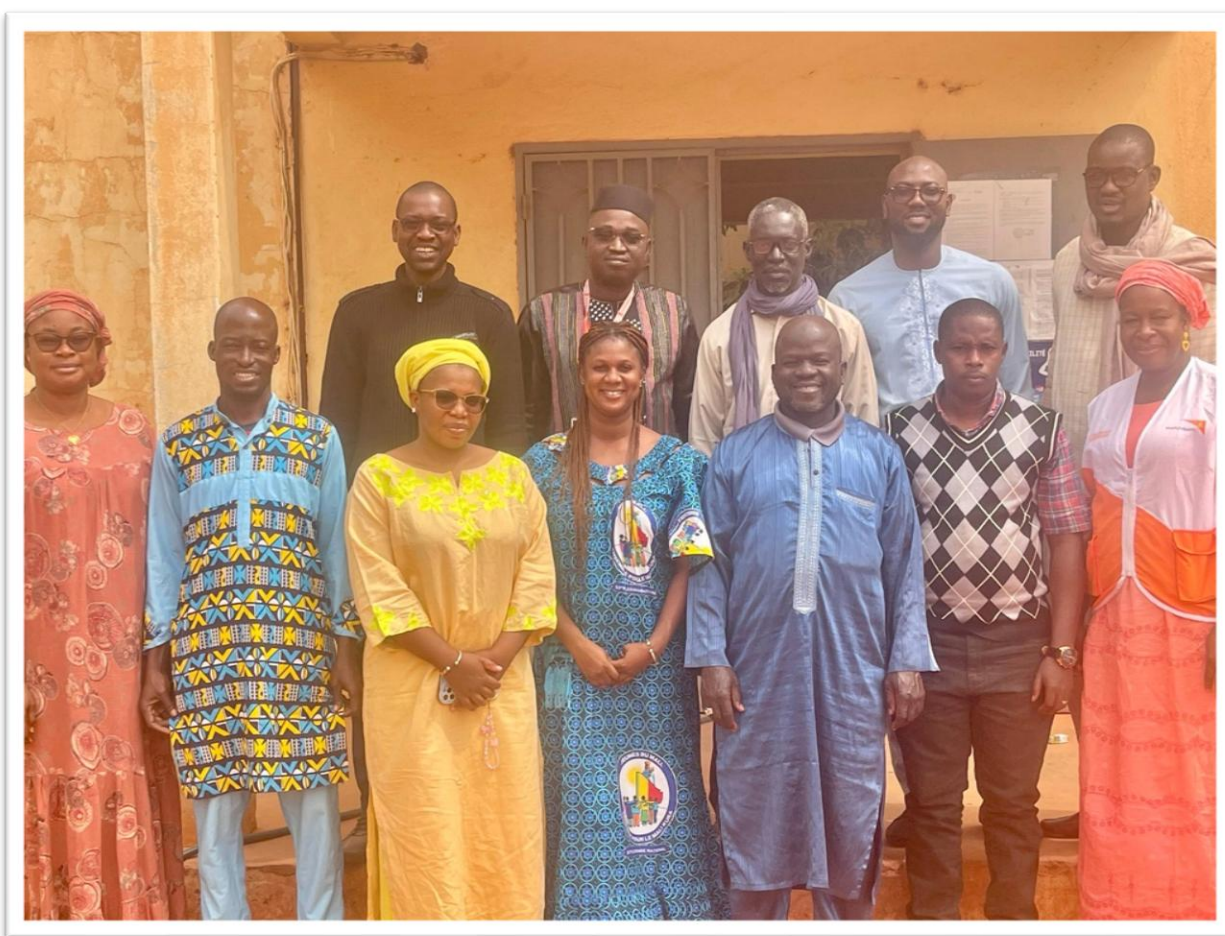
Image 1 : Cérémonie de famille de l'atelier de mise en place d'un mécanisme de remontée des données de Gestion de Cas à travers des formulaires digitalisés, étape de Gao